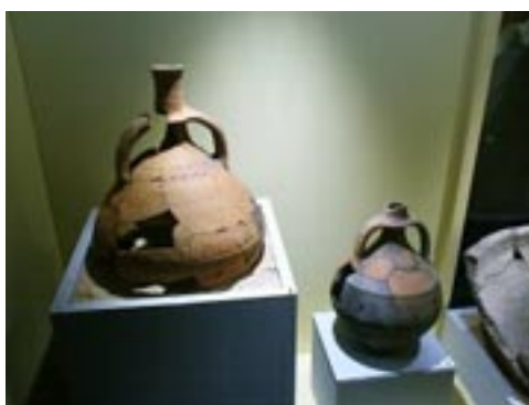
Vasijas encontradas en La Cabeza de Navansangil.

Es el único abierto al público de Castilla y Leon y está totalmente reconstruido. Actualmente se pueden hacer rutas guiadas 4x4.