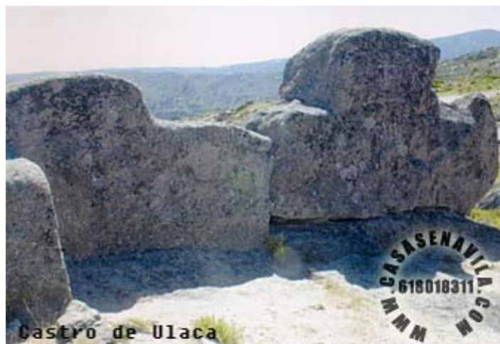
Castro de "Ulaca". Altar excavado en la roca