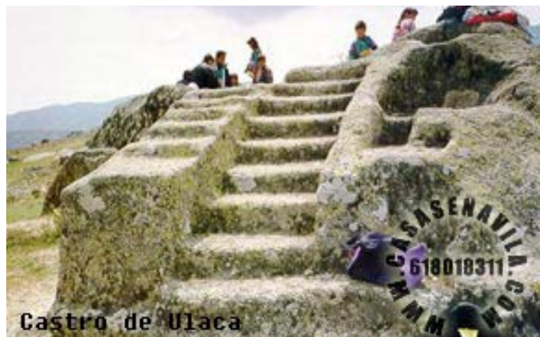
Castro de "Ulaca". Altar de Sacrificios

Con el abandono del Castro de Ulaca después de la conquista romana, surgen en las tierras llanas de las inmediaciones diversos poblados inmersos ya en la cultura romana. Pero será al final de esta etapa y durante la siguiente -época visigoda- en la que son construidos algunos asentamientos de gran importancia. Uno de ellos es el denominado La Cabeza de Navasangil , en las estribaciones de la sierra, en medio de un paisaje serrano muy abrupto e intacto, caracterizado por las formaciones graníticas.